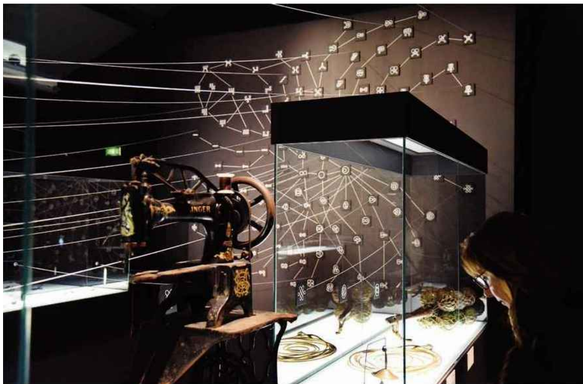
Le Mucem a donné carte blanche à Johann Le Guillerm afin de revisiter les objets de ses collections. « Évolutions élastiques » propose ainsi leur relecture sous forme de boucle. A voir au Fort Saint-Jean dès ce week-end.